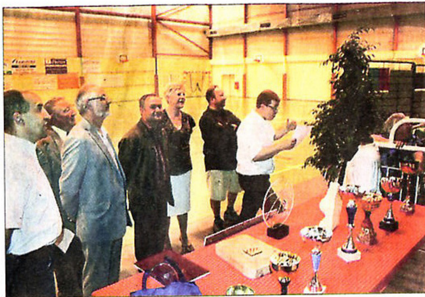
■ A l'heure des discours.

Le vice-président fait ensuite référence à l'exposition qu'il a eu le plaisir de présenter à l'assemblée, (élus, licenciés, comité départemental, parents, amis...) juste avant l'ouverture du bal des discours : une trentaine de panneaux, un travail de titan, où foisonnent documents, photographies, coupures de presse,