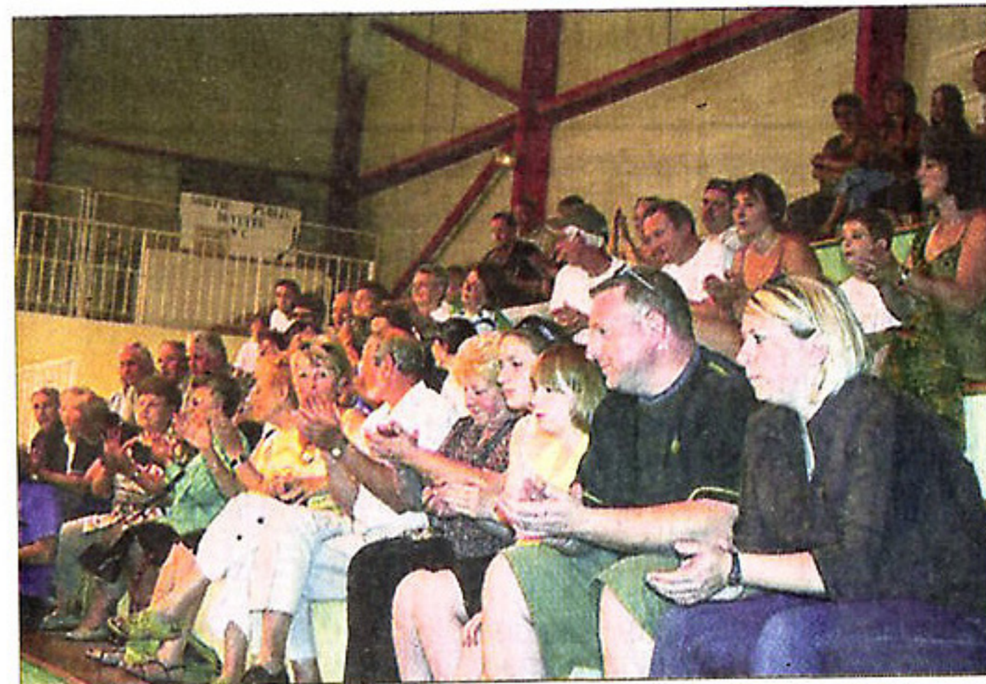
■ Confortablement installés dans les tribunes.